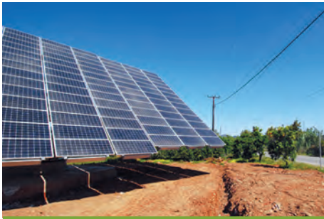
79,92 kW ΠΕΡΑ ΜΠΑΝΤΑ, Ν. ΧΑΝΙΩΝ

Εξοπλισμός 432 X BIOENERGY BIO185W 3 X MECHATRON ATLAS T150 + 1 X DEGER 5000NT 3 X KACO 25000xi + 1 X KACO 5000xi