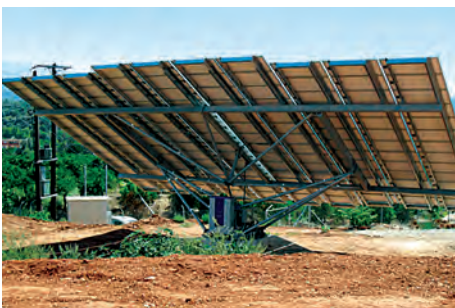
80,00 kW ΣΟΧΩΡΑ, Ν. ΧΑΝΙΩΝ

Εξοπλισμός 400 X SUNTECH HiPerforma PLUTO 200Ade 3 X MECHATRON ATLAS T150 6 X SMA SMC 8000 TL + 3 SMA SMC 11000TL