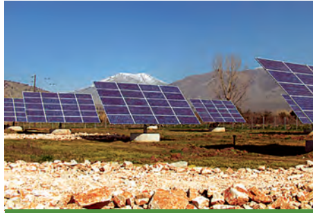
97,2 kW ΚΑΜΠΗ, Ν. ΑΡΤΑΣ

Εξοπλισμός 350 X SUNTECH 270 - 24Vb 18 X DEGER 5000 NT 18 X SMA SB 5000TL