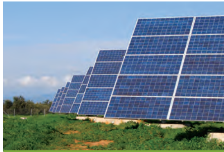
97,2 kW ΡΑΧΗ Ν. ΑΡΤΑΣ

Εξοπλισμός 360 X SUNTECH 270-24Vb 18 X DEGER 5000 NT 18 X SMA SB 5000TL