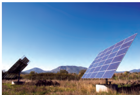
19,44kW ΠΑΡΑΣΠΟΡΟΙ, Ν.ΜΕΣΣΗΝΙΑΣ

Εξοπλισμός 120 X SUNTECH 280W + 239 X SUNTECH 275W 10 X DEGER 9000 6 X SMA TRIPOWER 15000TL + 1X SMA TRIPOWER 10000TL