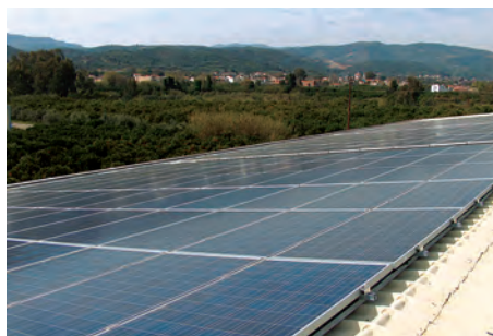
79,80 kW ΑΛΙΚΙΑΝΟΣ, Ν. ΧΑΝΙΩΝ

Εξοπλισμός 400 X SUNTECH HiPerforma PLUTO 200Ade 3 X MECHATRON ATLAS T150 3 X KACO 25000xi