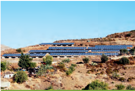
99,68 kW ΚΑΜΑΡΑ, ΝΗΣΟΣ ΛΕΡΟΣ

Εξοπλισμός 356 X SUNTECH STP 280W 18 X DEGER 5000NT 18 X SMA SUNNY BOY 5000TL