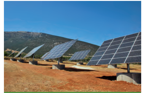
99,68kW ΚΡΑΝΙΔΙ, Ν. ΑΡΓΟΛΙΔΑΣ

Εξοπλισμός 526 X SUNTECH 190W 18 X DEGER 5000NT 6 X SMA TRIPOWER 17000TL