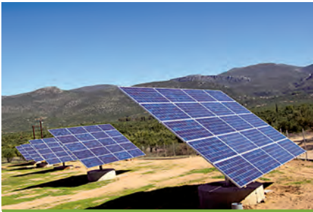
99,68 kW ΑΡΦΑΡΑ, Ν. ΜΕΣΣΗΝΙΑΣ

Εξοπλισμός 356 X SUNTECH 280-24Vd SCHLETTER PVMAX3 9 X SMA SMC 11000TL