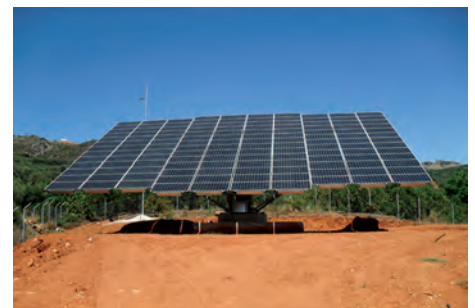
77,40 kW ΛΙΜΝΙΑ, Ν. ΧΑΝΙΩΝ

Εξοπλισμός 432 X BIOENERGY BIO180W HILTI MSP-AL EL 9 X KACO 8000xi