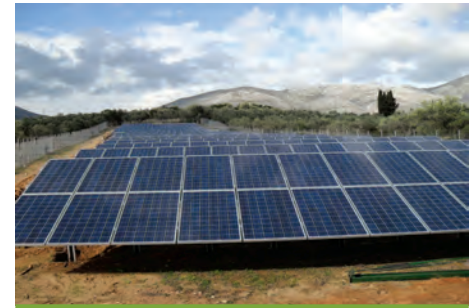
149,94 kW ΛΥΓΟΥΡΙΟ, Ν.ΑΡΓΟΛΙΔΑΣ

Εξοπλισμός 520 X UP SOLAR 190 5 X MECHATRON ATLAS T150 5 X SMA TRIPOWER 17000TL + 5X SUNNY BOY 3000TL