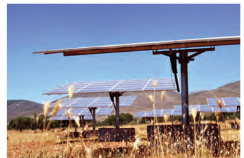
99.68 kW ΜΠΑΜΠΑΚΙΑ, Ν. ΛΑΚΩΝΙΑΣ

Εξοπλισμός 360 X SUNTECH 280-24Vd 18 X DEGER 5000 NT 18 X SMA SB 5000TL