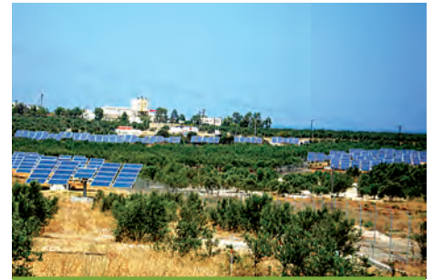
79,80 kW ΛΙΜΝΗ, Ν. ΡΕΘΥΜΝΟΥ

Εξοπλισμός 285 X SUNTECH 280-24Vd 12 X DEGER 7000NT 12 X KACO 6650xi