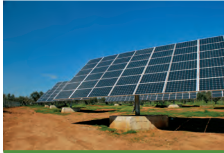
96,68kW ΑΙΓΙΟ, Ν.ΑΧΑΪΑΣ

Εξοπλισμός 356X SUNTECH STP 280W ΕΦ. ΠΕΡΙΒΑΛΛΟΝΤΟΣ INOX ALL 6 X SMA TRIPOWER 17000TL