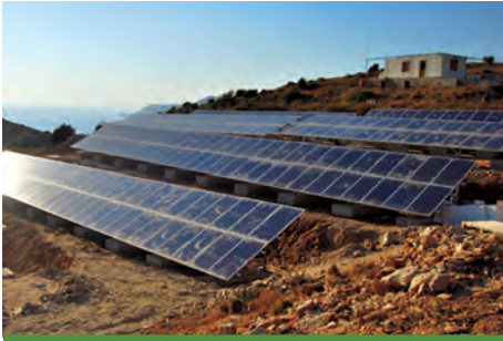
99,68 kW ΑΓ. ΠΕΤΡΟΣ, ΝΗΣΟΣ ΛΕΡΟΣ