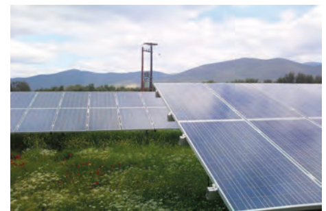
99,90 kW ΣΥΚΕΑ, Ν.ΛΑΚΩΝΙΑΣ

Εξοπλισμός 108 X SUNTECH ST1805-24AD 4 X DEGER 5000NT 3 X SMA SUNNY BOY 5000 + 3 X SMA SUNNY BOY 1700