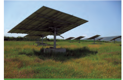
99.00 kW ΦΙΛΙΠΠΙΑΔΑ, Ν.ΠΡΕΒΕΖΗΣ

Εξοπλισμός 402 X SOLAR FABRIC 240W 10 X DEGER 9000NT 9 X SMA SMC 9000TL + 1X SMA TRIPOWER 10000TL