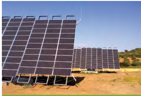
99,75 kW ΛΑΜΙΑ, Ν.ΦΘΙΩΤΙΔΑΣ

Εξοπλισμός 356 X SUNTECH STP 280W ΕΦ. ΠΕΡΙΒΑΛΛΟΝΤΟΣ INOX ALL 6 X SMA TRIPOWER 17000TL