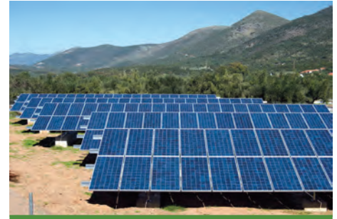
99,68 kW ΑΡΦΑΡΑ, Ν. ΜΕΣΣΗΝΙΑΣ

Εξοπλισμός 378 X ALEO S -18 220W SCHLETTER FS1 VARIO 6 X SMA SMC 10000TL + 3 X SMA SMC 7000TL