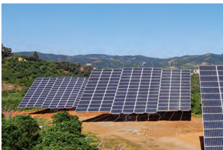
77,40 kW ΚΕΡΙΤΗΣ, Ν. ΧΑΝΙΩΝ

Εξοπλισμός 285 X SUNTECH 280W 24-Vd 12 X DEGER 7000NT 12 X KACO 6650xi