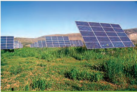
97,2 kW ΡΑΧΗ Ν. ΑΡΤΑΣ 1

Εξοπλισμός 360 X SUNTECH 270-24Vb 18 X DEGER 5000 NT 18 X SMA SB 5000TL