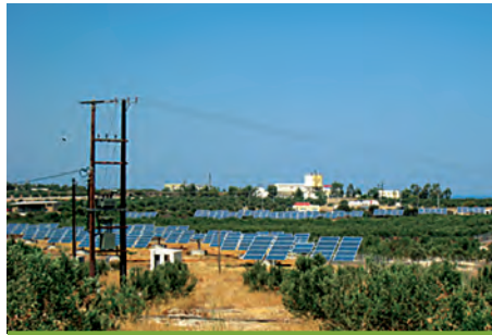
79,80 kW ΛΙΜΝΗ, Ν. ΡΕΘΥΜΝΟΥ

Εξοπλισμός 432 X BIOENERGY BIO185W 3 X MECHATRON ATLAS T150 + 3 X MECHATRON ATLAS T50 3 X SMA TRIPOWER 17000TL + 3 X SMA SMC 7000TL