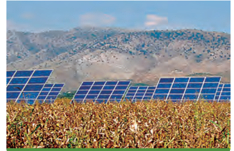
97,2 kW ΚΑΜΠΗ, Ν. ΑΡΤΑΣ

Εξοπλισμός 360 X SUNTECH 270-24Vb 18 X DEGER 5000 NT 18 X SMA SB 5000TL