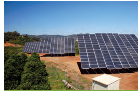
80,00 kW ΚΟΥΜΑΡΕΣ, Ν. ΧΑΝΙΩΝ

Εξοπλισμός 400 X SUNTECH HiPerforma PLUTO 200Ade 3 X MECHATRON ATLAS T150 6 X SMA SMC 8000 TL + 3 X SMA SMC 11000TL