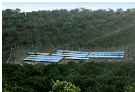
79,92 kW ΠΛΑΪ ΚΟΥΜΑΡΙΕΣ, Ν. ΧΑΝΙΩΝ

Εξοπλισμός 430 X BIOENERGY BIO180W 4 X MECHATRON ATLAS T150 2 X SMA TRIPOWER 17000TL + 6 X SMA SMC 7000TL