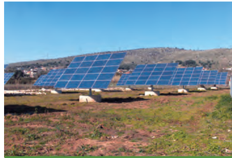
99,00 kW ΣΑΓΙΑΔΑ, Ν.ΘΕΣΠΡΩΤΙΑΣ

Εξοπλισμός 356 X SUNTECH 280W ΕΦ. ΠΕΡΙΒΑΛΛΟΝΤΟΣ SOLAR TRACK 6 X SMA TRIPOWER 17000TL