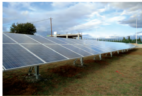
99,36 kW ΑΜΟΥΤΣΕΣ, Ν.ΑΡΚΑΔΙΑΣ

Εξοπλισμός 499 X SUNTECH PLUTO 200W 12 X MECHATRON ATLAS T50 6 X SMA TRIPOWER 17000TL