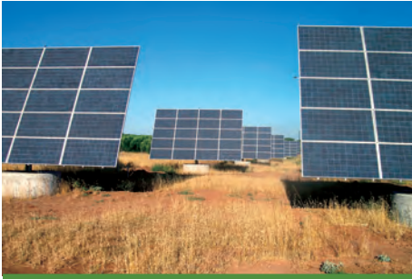
94,5 kW ΑΓΡΙΛΙΣ, Ν. ΜΕΣΣΗΝΙΑ