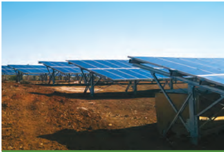
99,68 kW ΚΟΡΩΝΗ, Ν.ΜΕΣΣΗΝΙΑΣ