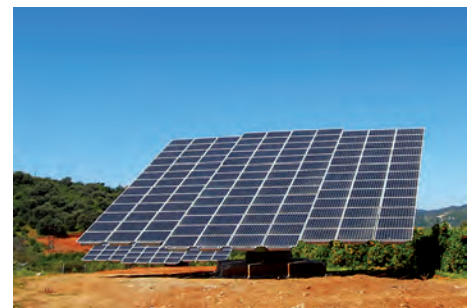
79,92 kW ΚΟΥΤΣΟΥΡΕΣ, Ν. ΧΑΝΙΩΝ

Εξοπλισμός 285 X SUNTECH 280-24Vd HILTI MSP-AL EL 6 X SMA SMC 10000TL + 3 X SMA SMC 7000TL