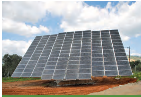
80,00 kW ΚΟΥΜΑΡΕΣ Ν. ΧΑΝΙΩΝ

Εξοπλισμός 400 X SUNTECH HiPerforma PLUTO 200Ade 3 X MECHATRON ATLAS T150 3 X KACO 25000xi