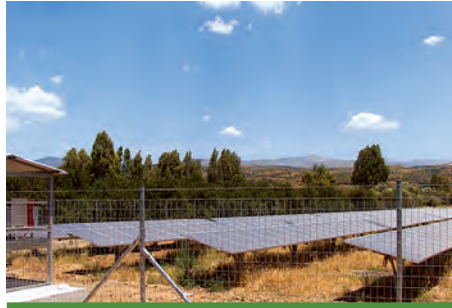
83,16 kW ΣΠΑΡΤΗ, Ν. ΛΑΚΩΝΙΑΣ

Εξοπλισμός 369 X SUNTECH 270 - 24Vd SCHLETTER PVMAX2 6 X SMA SMC 11000TL + 3 X SMA SMC 10000TL