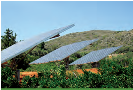
80,00 kW ΦΟΥΡΝΕΣ, Ν. ΧΑΝΙΩΝ