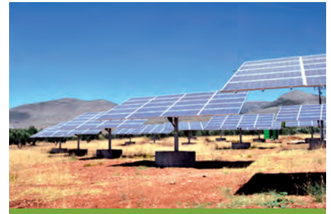
99.68 kW ΧΑΛΙΚΙΑ, Ν. ΛΑΚΩΝΙΑΣ 1

Εξοπλισμός 360 X SUNTECH 270-24Vb 18 X DEGER 5000 NT 18 X SMA SB 5000TL