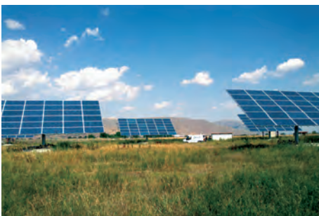
99,00 kW ΟΙΧΑΛΙΑ, Ν.ΤΡΙΚΑΛΩΝ

Εξοπλισμός 588 X SCHEUTEN P66 255W SLETTER F5 9 X SMA TRIPOWER 17000TL