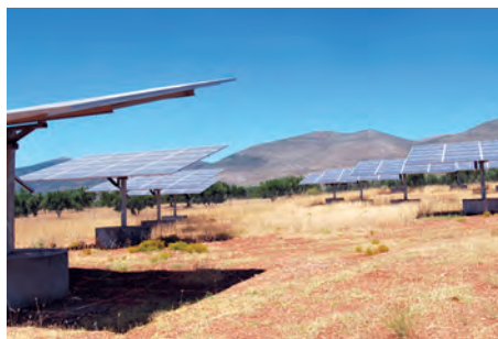
99.68 kW ΣΟΥΛΕΪΜΑΝΙ, Ν. ΛΑΚΩΝΙΑΣ

Εξοπλισμός 360 X SUNTECH 280-24Vd 18 X DEGER 5000 NT 18 X SMA SB 5000TL