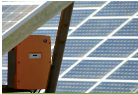
80,00 kW ΕΠΙΣΚΟΠΗ, Ν. ΧΑΝΙΩΝ

Εξοπλισμός 356 X SUNTECH 280-24Vd 20 X DEGER 5000NT 20 SMA SB 5000TL