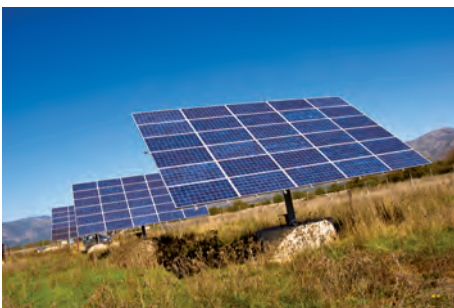
99.68 kW ΣΕΣΙ, Ν. ΛΑΚΩΝΙΑΣ

Εξοπλισμός 360 X SUNTECH 280-24Vb 18 X DEGER 5000 NT 18 X SMA SB 5000TL