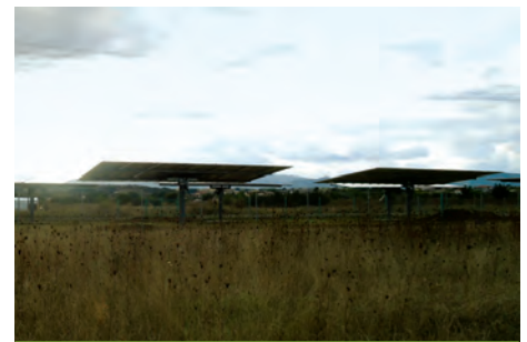
99,82 kW ΓΚΟΡΤΣΙΑ, Ν.ΑΡΚΑΔΙΑΣ

Εξοπλισμός 432 X UP SOLAR 230W ΕΦ. ΠΕΡΙΒΑΛΛΟΝΤΟΣ SOLAR TRACK 6 X SMA TRIPOWER 17000TL