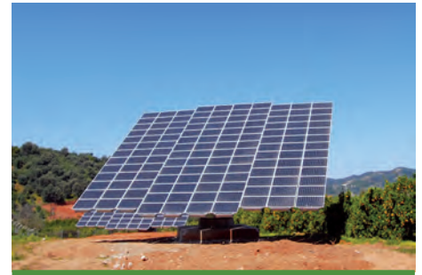
79,92 kW ΜΕΣΑ ΒΛΑΤΟΣ, Ν. ΧΑΝΙΩΝ

Εξοπλισμός 400 X SUNTECH HiPerforma PLUTO 200Ade 3 X MECHATRON ATLAS T150 3 X KACO 25000xi